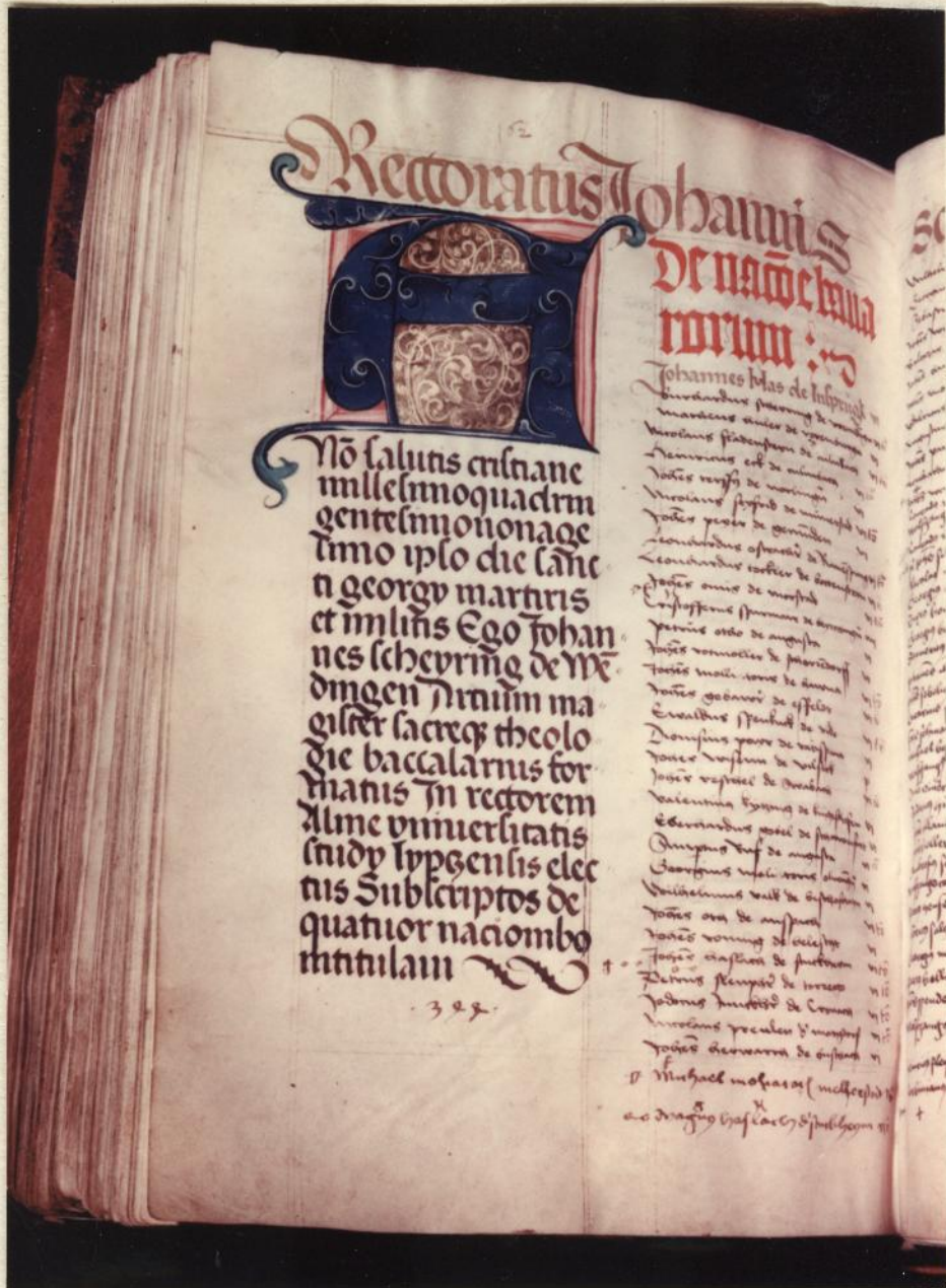
Farbphoto aus der Leipziger Universitätsmatrikel, Sommersemester 1490. Aufn. der Hochschule-Film- und -Bildstelle Leipzig, 1966.