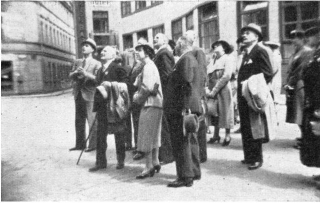
Vor der St. Ulrichkirche