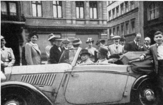
Abfahrt zum Herrenkrug