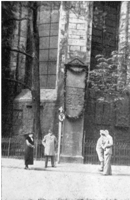
Das Ziering-Wappen an der St. Ulrichkirche