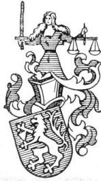
Wappen der familie Meißner