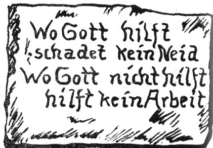
Wappen und Wappenspruch der Familie Kessler